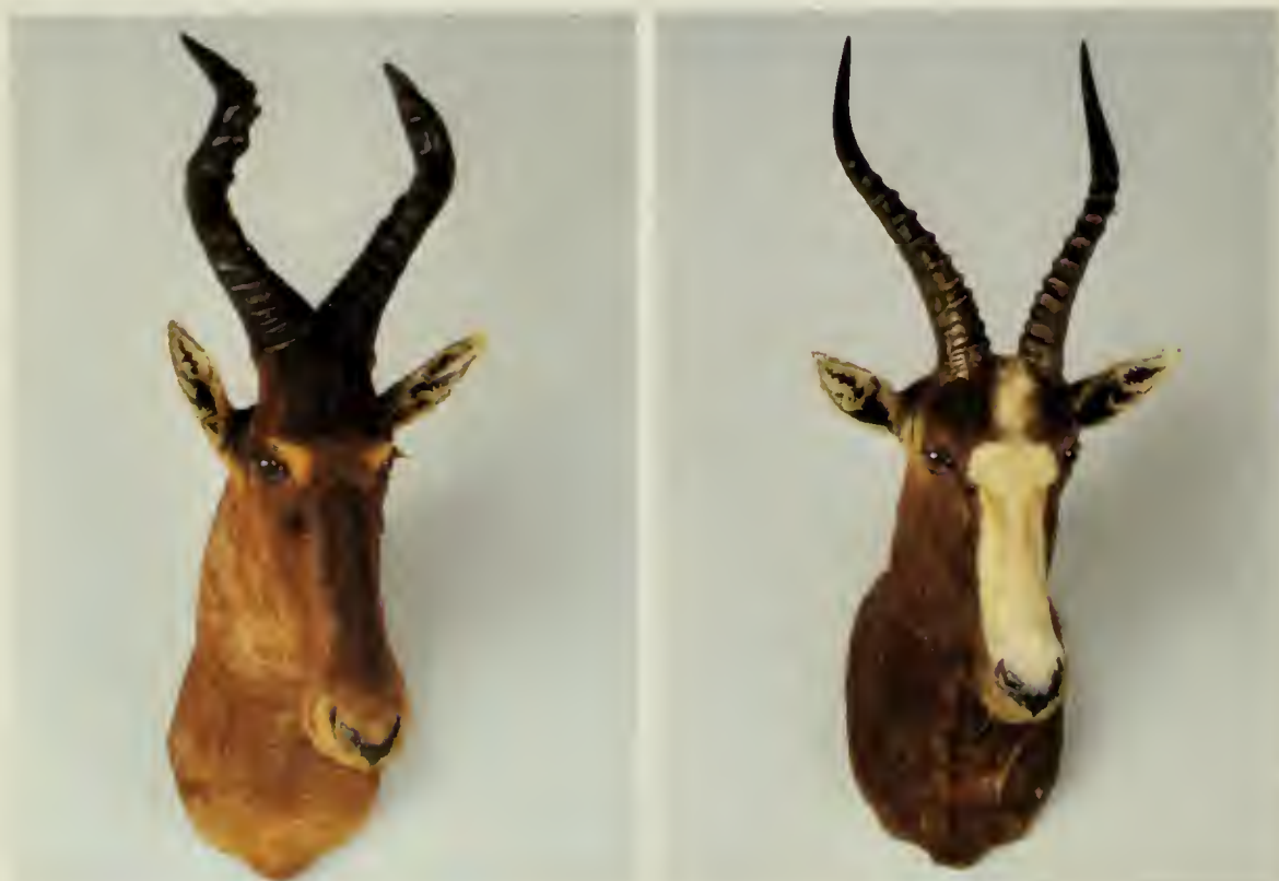
A sinistra: Alcelafo rosso ( Alcelaphus buselaphus selbornei Lydekker, 1913); a destra: Bontebok ( Damaliscus dorcas dorcas Pallas, 1766).